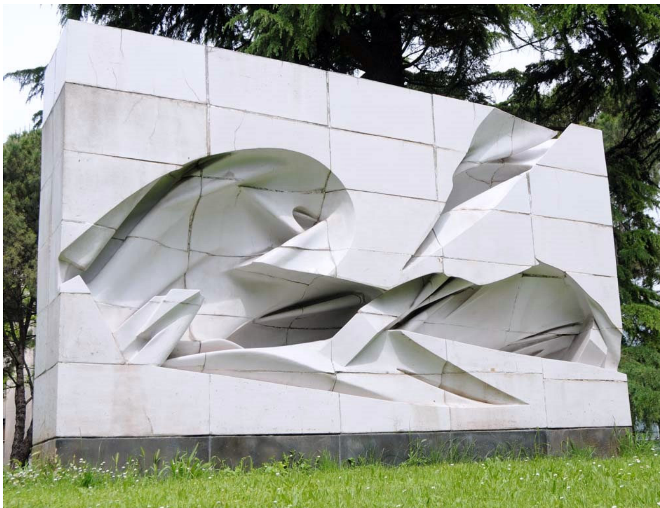
Veduta da viale Baccarini